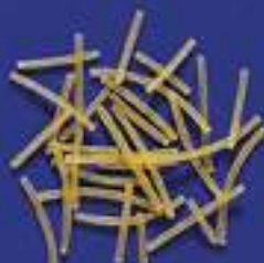
36 FILINI 500 g