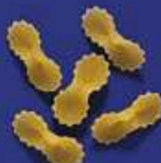
18 FARFALLINE 5 Kg - 500 g