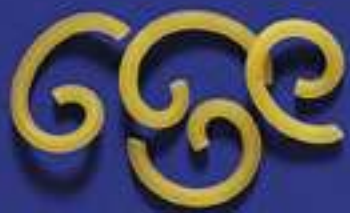
12 GRAMIGNA GARIBALDINA 5 Kg - 500 g