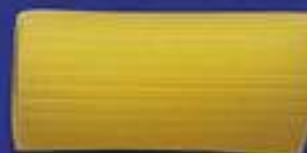
65 MILLERIGHE 5 Kg - 500 g