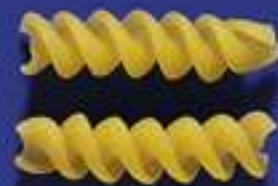
82 FUSILLI 5 Kg - 500 g