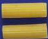
71 TORTIGLIETTI 5 Kg