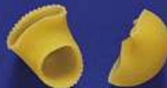
77 GOBBI 5 Kg - 500 g