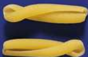
78 STROZZAPRETI 5 Kg - 500 g