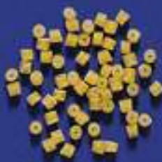
21 CENTINBOCCA 5 Kg - 500 g