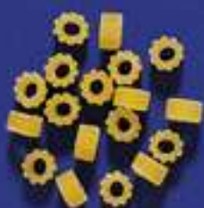
30 CANNELLINI 5 Kg - 500 g