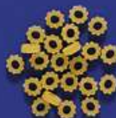
46 ANELLINE 5 Kg - 500 g