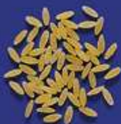
40 PUNTINE 5 Kg - 500 g