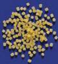
20 GRANDININA 5 Kg - 500 g