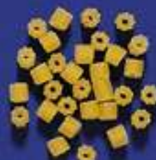
24 CORALLINI 5 Kg - 500 g