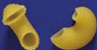
75 GOBBINI 5 Kg - 500 g