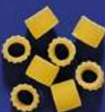
31 DITALINI 5 Kg - 500 g