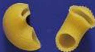
76 GOBBETTI 5 Kg - 500 g