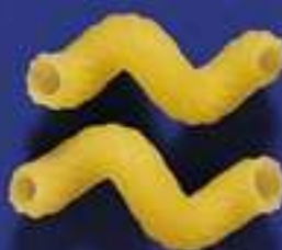
69 STORTELLI 5 Kg - 500 g