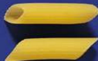
72 PENNE ZITE 5 Kg - 500 g