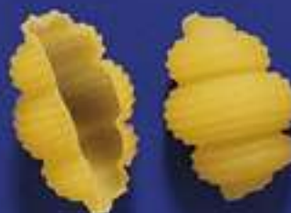
81 CONCHIGLIE 5 Kg - 500 g