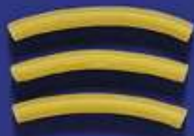
60 FIAMMIFERINI 5 Kg - 500 g