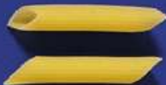
57 PENNE 5 Kg - 500 g