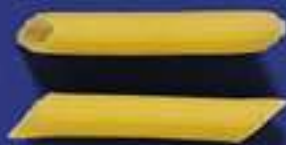
55 PENNETTE 5 Kg - 500 g