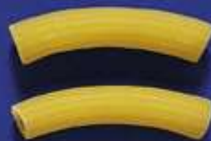
62 SEDANI 5 Kg - 500 g