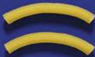
61 SEDANINI 5 Kg - 500 g