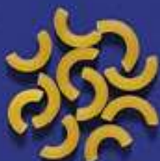
35 STORTINI 500 g