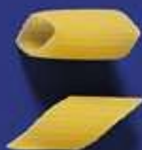
54 MEZZE PENNE 5 Kg - 500 g