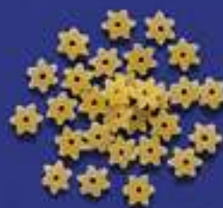
38 STELLINE 5 Kg - 500 g