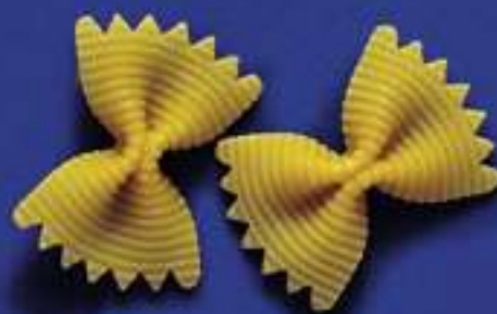
19 FARFALLE RIGATE 5 Kg - 500 g