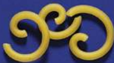
14 GRAMIGNA RICCIA 5 Kg - 500 g