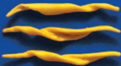
187 TRIVELLINI 5 Kg - 500 g