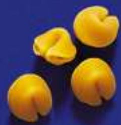
106 SORPRESE 5 Kg - 1 Kg- 250 g