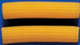
162 MACCHERONCINI 5 Kg - 500 g