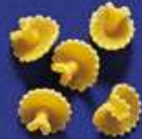
109 MARGHERITE 5 Kg - 1 Kg- 500 g