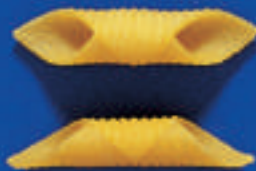
177 GARGANELLI MIGNON 5 Kg - 500 g