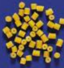
111 CENTIMBOCCA 5 Kg - 1 Kg- 250 g