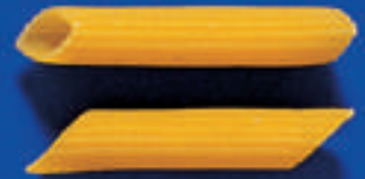
158 PENNETTE 5 Kg - 500 g