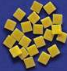
108 QUADRETTI 5 Kg - 1 Kg- 250 g