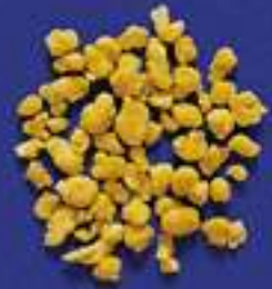
134 GRATTINI CASERECCI 5 Kg - 1 Kg- 250 g