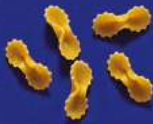
102 FARFALLINE 5 Kg - 1 Kg- 250 g