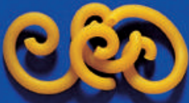
114 GRAMIGNA RICCIA 5 Kg - 500 g