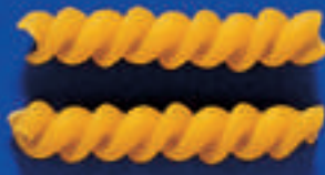
182 FUSILLINI 5 Kg - 500 g