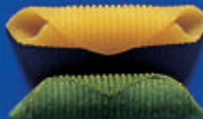
180 GARGANELLI ROMAGNOLI PAGLIA E FIENO 5 Kg - 500 g - 250 g