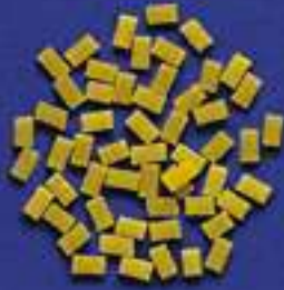
107 QUADRETTINI 5 Kg - 1 Kg- 500 g