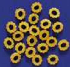
146 ANELLINE 5 Kg - 1 Kg- 250 g