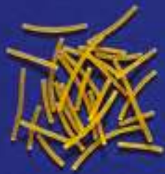
100 FILINI 5 Kg - 1 Kg- 250 g