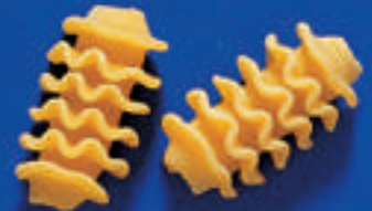
186 RICCIOLI 5 Kg - 500 g