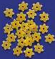
138 STELLINE 5 Kg - 1 Kg- 250 g