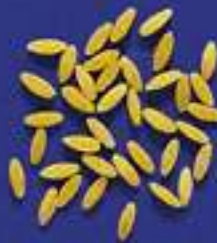
140 PUNTINE 5 Kg - 1 Kg- 250 g