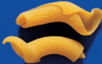
118 TORCHIETTI 5 Kg - 500 g