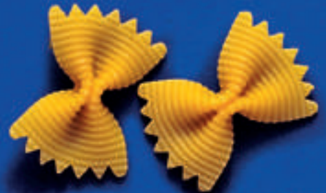
103 FARFALLE RIGATE 5 Kg - 500 g