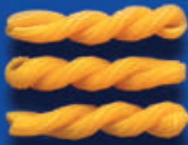
197 SPARGIOTTI 1 Kg - 500 g