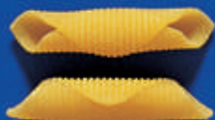
179 GARGANELLI ROMAGNOLI 5 Kg - 1 Kg - 500 g - 250 g