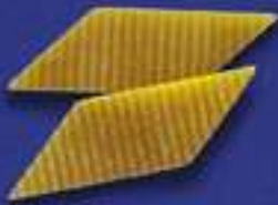
110 MALTAGLIATI RIGATI 5 Kg - 1 Kg- 250 g